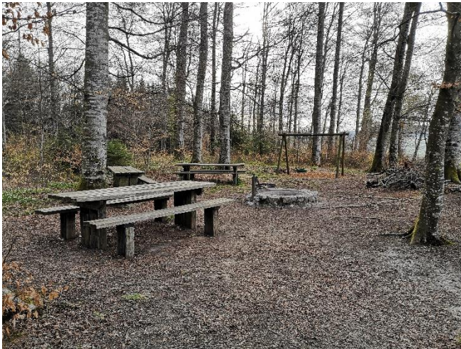
Grillplatz Hüenerhüsli, Heinrichswil

Wir danken Ihnen, wenn Sie zu unseren Plätzen Sorge tragen und diese sauber wieder verlassen.