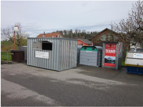
Areal Gemeindehaus Drei Höfe, Winistorf

Seit 1. April 2021 bewirtschaftet ein einziges Unternehmen, die Firma Neuenschwander, die Sammelstelle in Winistorf.